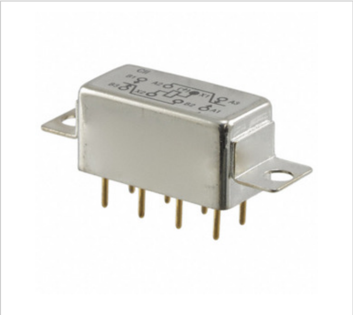
La imagen puede ser representación. Ver especificaciones para detalles del producto.