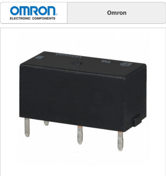
La imagen puede ser representación. Ver especificaciones para detalles del producto.